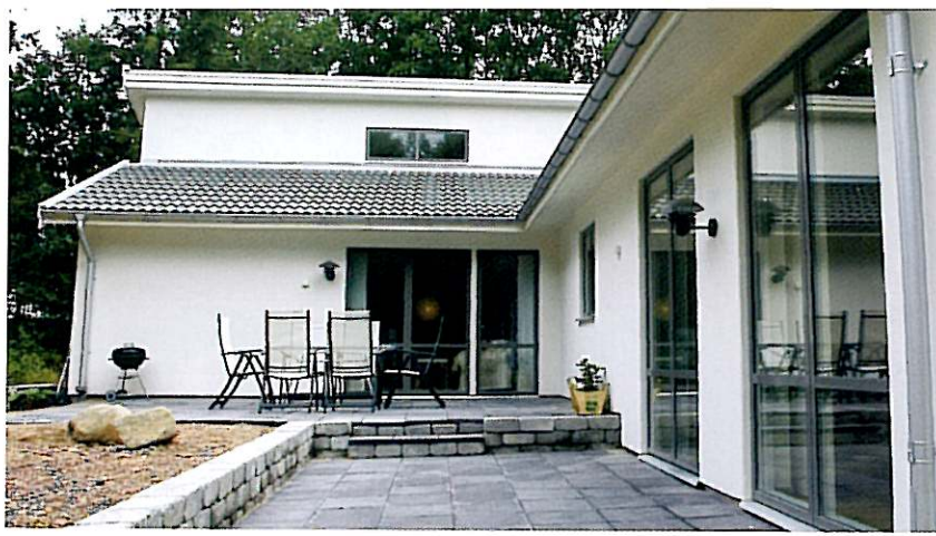
Den väl tilltagna terrassen är idealisk för att njuta av ljumma kvällar i skogens sus.