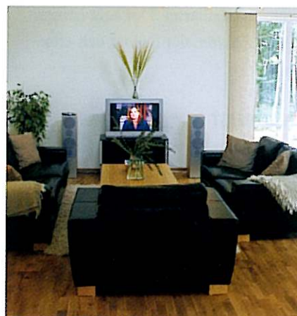
Det är inte bara arkitekturen som går i nyfunkis, inredningen harmonierar med inbjudande elegans.